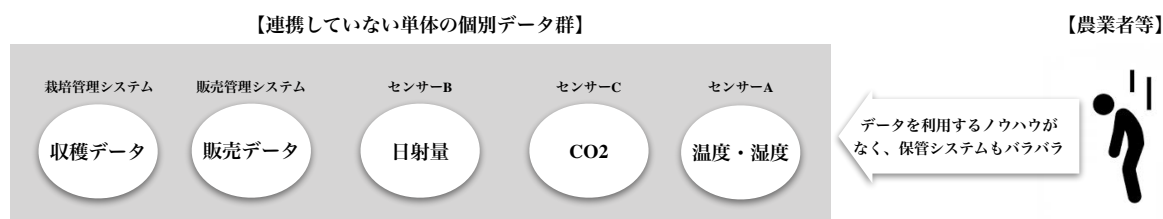
（図.2：農業ICTサービスの課題）

現状、農業現場におけるICTサービス（システム）同士の連携事例は少なく、農業者は目的ごとにシステムを導入する必要があり、農業者にとって非効率かつ多大な負担が生じています。また、システムに蓄積された膨大なデータの活用は進んでおらず、データの解析は専門家の知見を用いて分析した結果をわかりやすく現場の農業者やJA指導員などに届ける必要があります。（図.2）