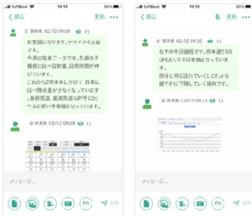
(図.3 : RightARMからの分析データをFarmChat上で表示 ※FarmChat画面キャプチャ)

本サービスの連携によりFarmChatユーザーはRightARM上に蓄積されたデータの分析サービスをリアルタイムかつチャットで手軽に受け取ることが可能となりました。(図.3)